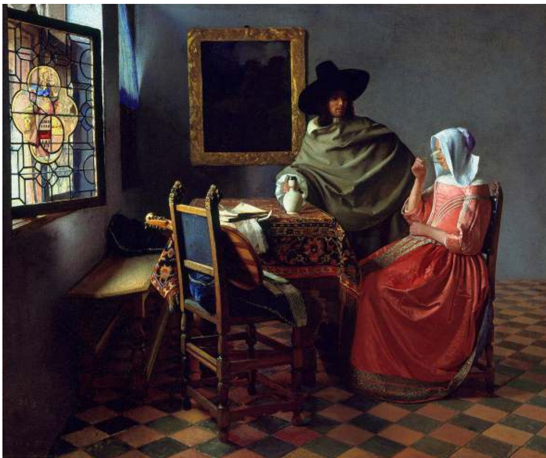
Vermeer : Het Glas Wijn