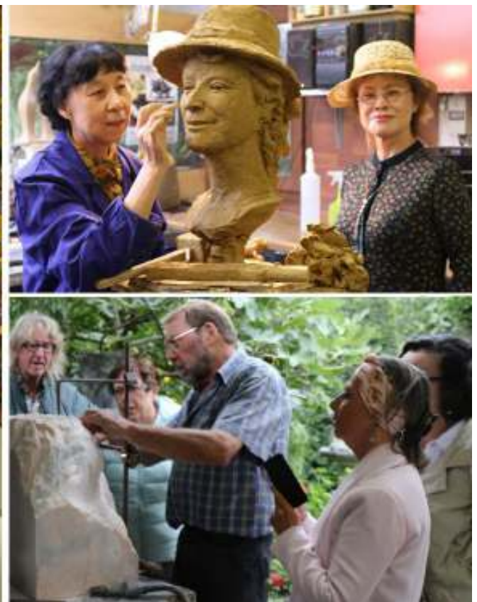
'10 jaar Montmartre' Ontwerp : Herwig Van Mieghem