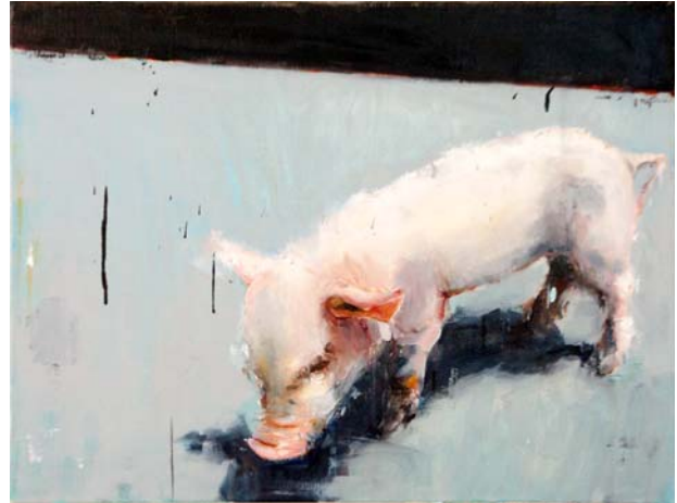
"Svin I" & "Svin II".