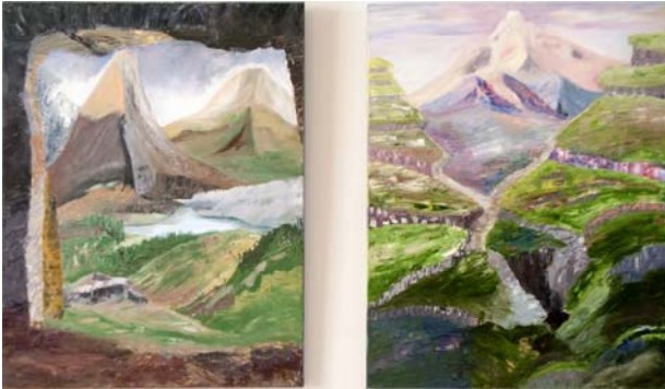
"Point of View" + "Olympus".

Deze werken werden geselecteerd omwille van de directe schildering vanuit de buik, zwaar in de materie met een bevreedende dieptewerking.