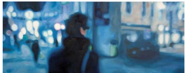
"Man in the City".

Dit werk werd uitgekozen omwille van het suggestieve dwaallicht dat over dit schilderij zweeft. Het wazig effect dat ons niet in staat stelt om te focussen op het schilderij wekt een fascinerend aspect op.