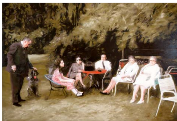
"Random Memories 01".

De inzending van deze kunstenaar werd als een sterke reeks ervaren van filmische tafere-len met een dartele penseelvoering waarin familiefoto's een andere dimensie krijgen.