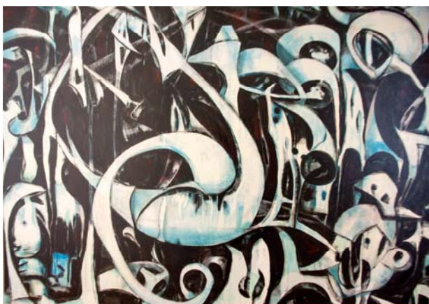
"Birds of Another Feather".

De jury zag een ambigue schilderij met een constructieve, vormelijke opbouw die abstract overkomt maar tegelijkertijd ook organisch figuratief lijkt, uitmondend in een futuristisch ogend city landschap.