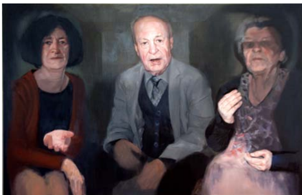
"Nina and her Parents".

Dit klassiek figuratief schilderij werd gekozen omwille van zijn grote zeggingskracht die vervreemding oproept.