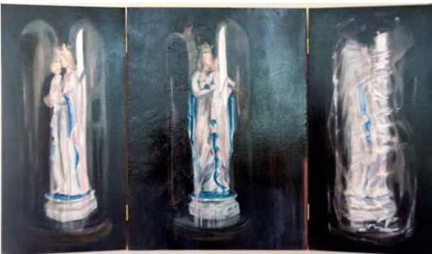
"Everything Finally Gets Wrapped Up".

Deze triptiek werd gekozen omwille van de complementaire penseelvoering die van een statisch beeld een dynamisch geheel maakt.