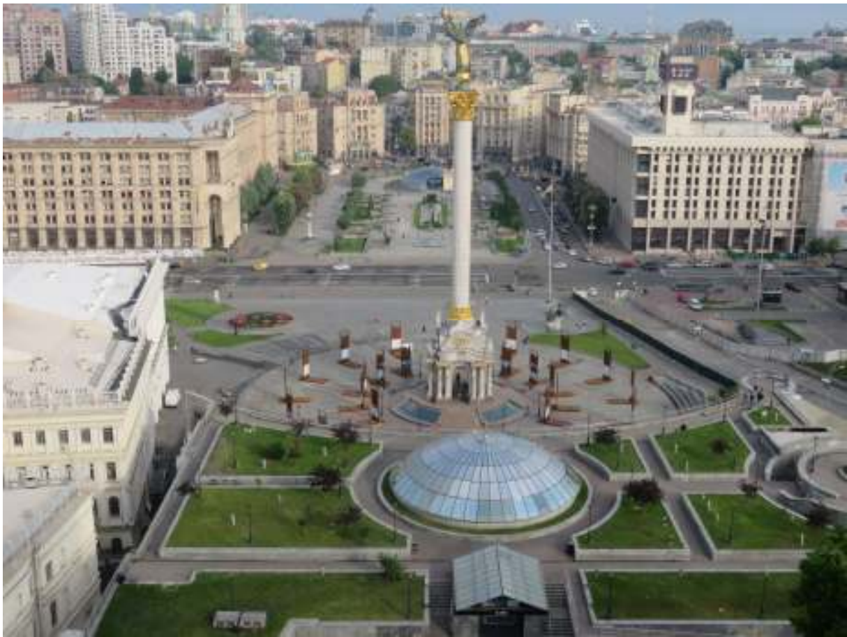
Uitzicht vanuit ons hotel 'Ukraina' in Kiev : het fameuze Maidan-plein met rond de zuil de stalen herdenkingsplaten ivm de revolutie van 2014.